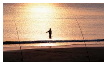
潮風を感じて(熱海港海釣り施設約2km)

※環境写真の距離は、西熱海和モダンからの距離です。また、写真は参考イメージです。