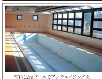
室内12mプールでアンチエイジングを。