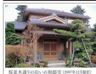
桜並木通りの沿いの和邸宅(2007年12月撮影)