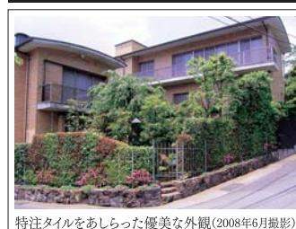
特注タイルをあしらった優美な外観(2008年6月撮影)