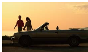
憧れのオープンカーを(ガレージ2台分有)