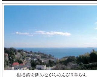
相模湾を眺めながらのんびり暮らす。